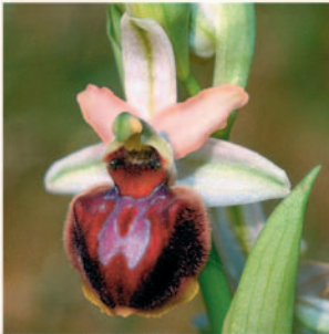
Les Sables d'Olonne (85), mars 2005.