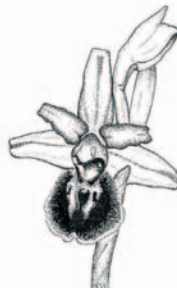
Segonzac (16), mars 1999