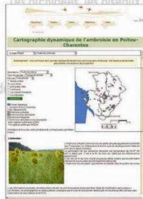
Répartition de l'ambroisie, interface du site PCN