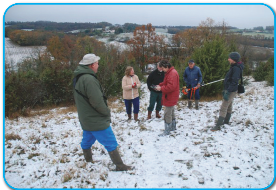
Ci-dessous : Rendez-vous sous la neige pour un débroussaillage inédit, à Juignac (16). Janvier 2011. Voir article «activités 2011», pages 4 à 6