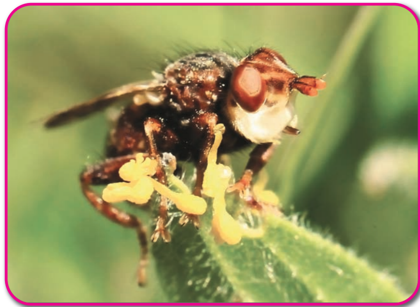
Mouche Myopa tessellatipennis porteuse de pollinies d'Ophrys « sphogodes précoce de Saint-Loup». Voir l'article pages 12 & 13