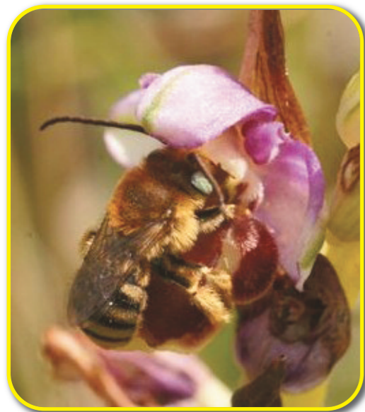
Ci dessus : Abeille du genre Tetralonia sur Ophrys santonica , Saint-Loup (17). Voir l'article pages 14 & 15